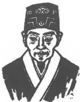
汤显祖像(木刻) 杨可扬 作